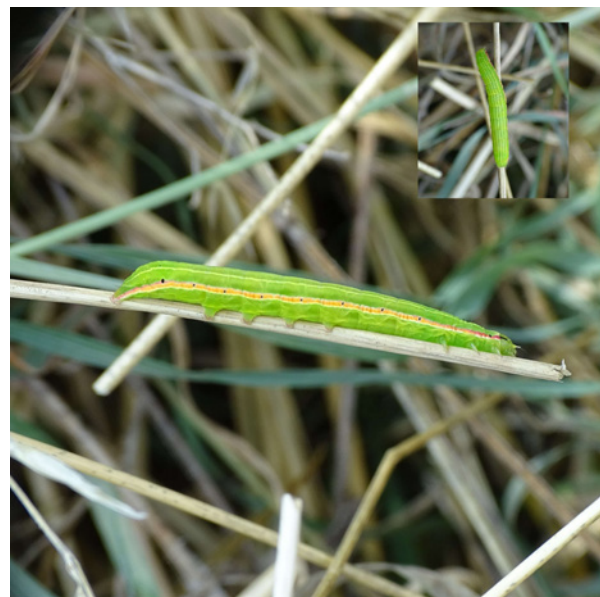
Raupe der Amethysteule.