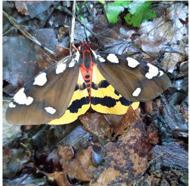
Augsburger Bär.