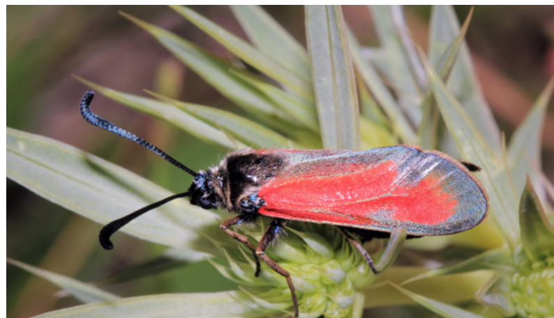
Zygaena punctum .