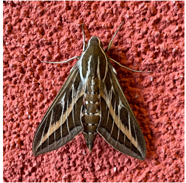
Altweltlicher Linienschwärmer.