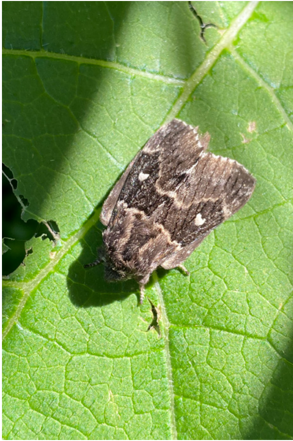
Mondfleckglucke.