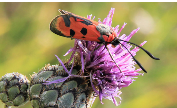
Zygaena laeta .

Der Japanische Eichenseidenspinner wurde im 19. Jahrhundert zur Seidengewinnung nach Europa importiert und auch in Österreich eingeschleppt. Die große und auffällige Art kommt in Österreich im Süden und Südosten vor und dehnt ihr Areal langsam weiter nach Norden aus. Sie wird seit 2016 regelmäßig mittels der App nachgewiesen und 2021 wurden 268 Datensätze übermittelt. Sie stammen aus dem bekannten Ver-