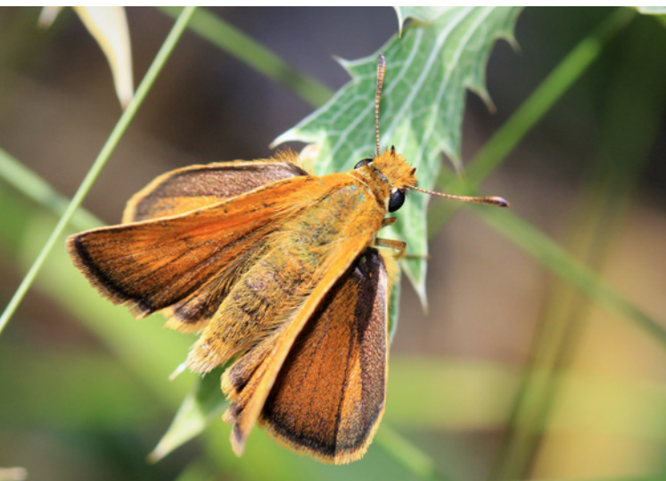
Mattscheckiger Braun-Dickkopffalter.