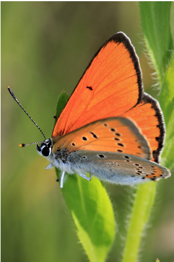
Großer Feuerfalter.

Von der FFH-Art Großen Feuerfalter liegen bei weitem die meisten Datensätze aller naturschutzrelevanten Arten vor (990). Die seit dem Bestehen der App von dieser Art gesammelten umfangreichen Daten stellen eine gute Grundlage für das Monitoring der Bestände in Österreich im Sinne der FFH-Richtlinie dar. Die weitere Ausbreitung in Oberösterreich, wie schon in den letzten Jahren mittels der App gut dokumentiert (z. B. HÖTTINGER 2019b, 2020b, 2021a) wird 2021 durch 128 Datensätze von 39 Fundorten bestätigt und mit konkreten Daten untermauert.