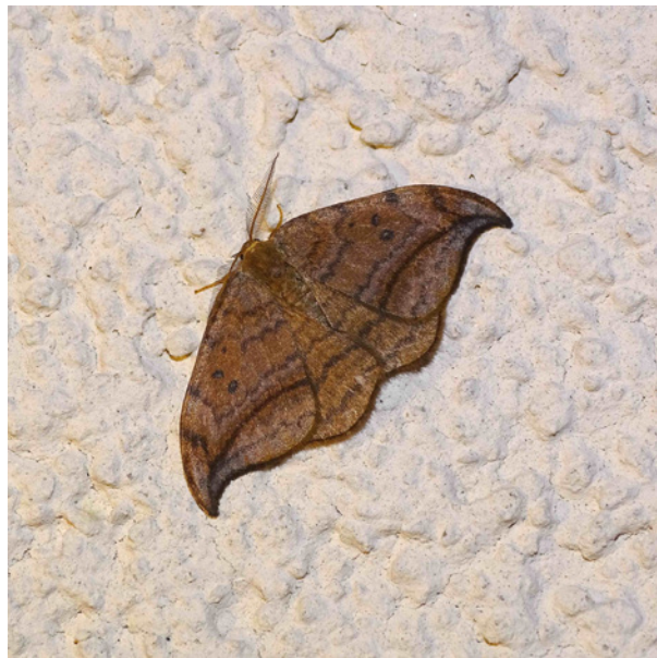
Erlen-Sichelflügler.