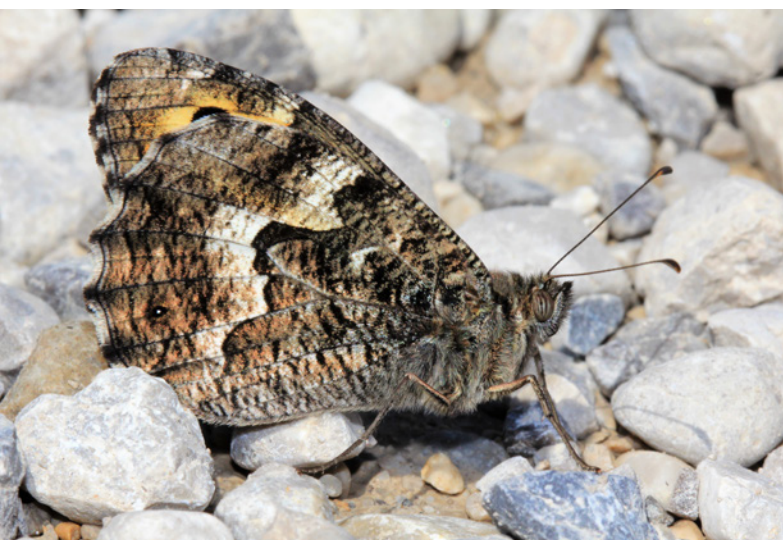
Ockerbindiger Samtfalter.

Diese xerothermophile Art wurde (sowohl als Falter, als auch im Raupenstadium) mit 60 Meldungen ausschließlich in Niederösterreich registriert, hauptsächlich in der Umgebung von Krems und im Kamptal. In diesem Gebiet befindet sich das letzte größere Vorkommen der Art in Österreich (HÖTTINGER & PENNERSTORFER 1999).