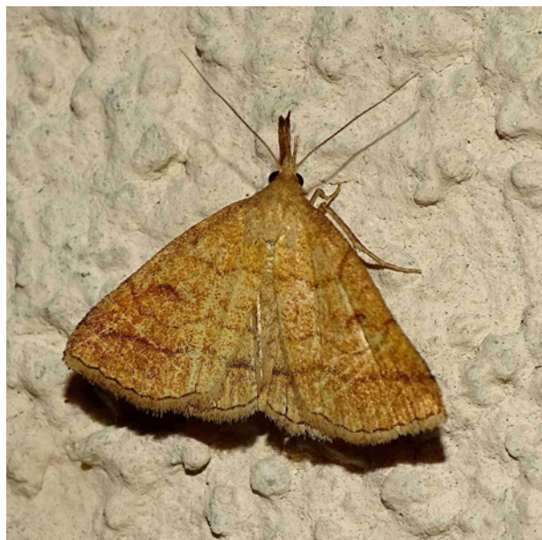
Syrmische Spannereule.

Sabine Gasparitz wies diese Art bereits am 5.8.2020 in einem Exemplar in Siebing (Steiermark) nach (ID 341893). Die Richtigkeit älterer „Nachweise“ der Art aus dem Burgenland und Niederösterreich wurde angezweifelt (HUEMER 2013), weshalb dieser Fund somit wahrscheinlich den tatsächlichen Erstnachweis für Österreich darstellt (HÖTTINGER 2021a). 2021 gelang Sabine Gasparitz wieder ein Nachweis an genau derselben Stelle in Siebing wie 2020. Sie fotografierte am 26.7. und 1.8. je einen Falter, bei dem es sich möglicherweise um ein und dasselbe Individuum gehandelt hat (ID 502746, ID 511264). Die Bodenständigkeit an diesem Fundort ist somit erwiesen. Auch auf verschiedenen anderen Plattformen im Netz (z. B. www.inaturalist.org ) wurden Meldungen aus der Steiermark aus den Jahren 2020 und 2021 hochgeladen.