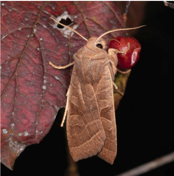
Große Wintereule.

Diese in Österreich relativ weit verbreitete Art ist als gefährdet eingestuft. Sie wurde 2021 an drei Fundorten nachgewiesen: am 1.4. von Wolfgang Kautz in Tullnerbach in Niederösterreich (ID 409855), am 5.10. von Dieter Schweiger in Gössendorf in der Steiermark (ID 580254) und am 23.10. von Ina Weber in Klagenfurt am Wörthersee in Kärnten (ID 580272).