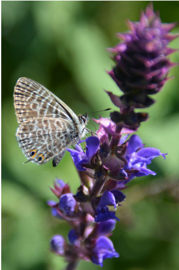
Kleiner Wander-Bläuling.

Erwähnt sei an dieser Stelle auch noch ein etwas älterer Fund aus Kärnten: am 2.9.2015 wurde ein frisches Exemplar (auf Goldrute saugend) aus Atschalas (bei Klagenfurt) auf „inaturalist“ gemeldet ( www.inaturalist.org/observations/70883815 ).